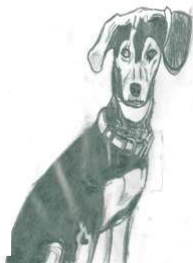
Kuba Bauer 3. třída